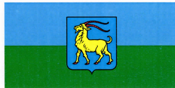
SLIKA 1. Zastava i grb

"Krasna zemljo, Istro mila dome roda hrvatskog Kud se ori pjesan vila, s Učke tja do mora tvog. Glas se čuje oko Raše, čuje Mirna, Draga, Lim Sve se diže što je naše za rod gori srcem svim. Slava tebi Pazin - grade koj' nam čuvaš rodni kraj Divne li ste, oj Livade nek' vas mine tuđi sjaj! Sva se Istra širom budi Pula, Buzet, Lošinj, Cres Svuđ pomažu dobri ljudi nauk žari kano krijes."