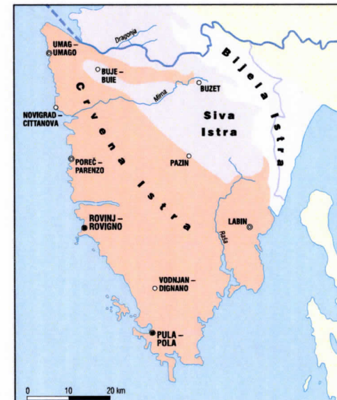
SLIKA 2. Reljefne cjeline Istre na temelju geološkog sastava i različitih vrsta tala

Zasebno geomorfološko obilježje Istre njezine su obale. Istra je, zajedno s Cresom, Lošinjem i ostalim otocima sjevernog Jadrana, prije 25000 godina činila jedinstveno kopno. Stoga su obalni predjeli Istre vrlo mladi, a formirani su pozitivnim gibanjima morske razine koja su započela i još traju od ledenoga doba.